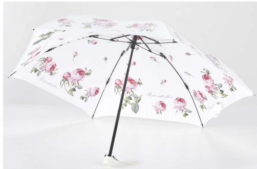
U006R / バラ柄