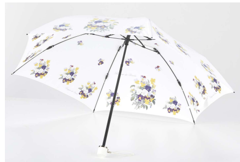
U006P / パンジー柄